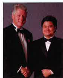
前美国总统克林顿与李东尼律师合影