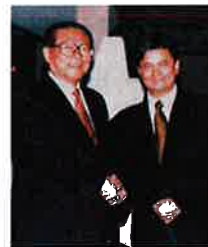
前中国国家主席江泽民与李东尼律师合影