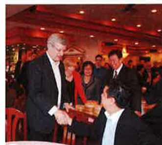
加拿大总理哈珀及夫人与李东尼律师合影